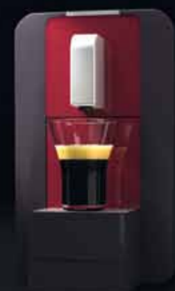
compact manual ruby red