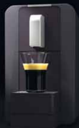
compact automatic piano black