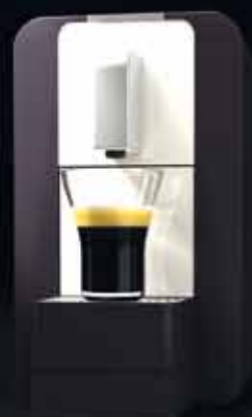
compact manual creamy white