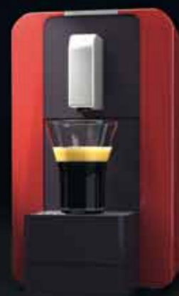
compact automatic rusty red